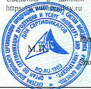
Схема сертификации 3с. Сведения о данном сертификате соответствия размещены в реестре выданных сертификатов на сайте https://certif.ru